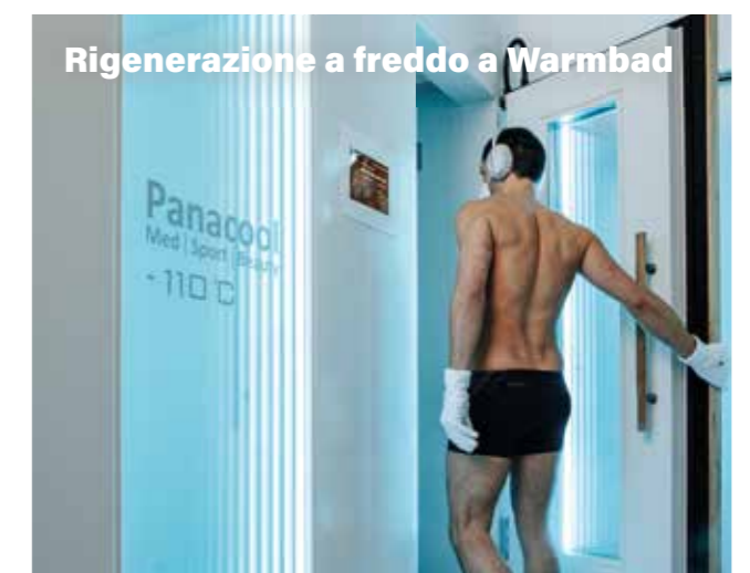
Rigenerazione a freddo a Warmbad