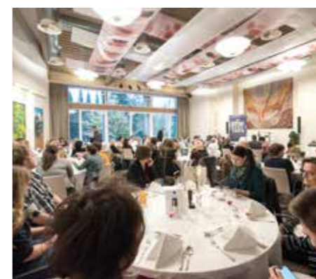
Festival del crimine Carinzia