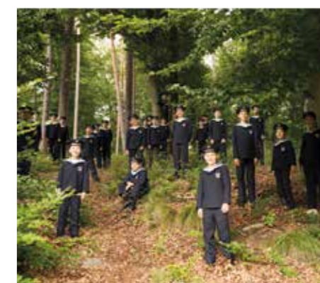
I Wiener Sängerknaben nel parco di Warmbad