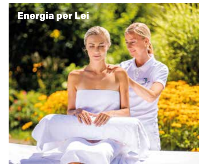
Energia per Lei