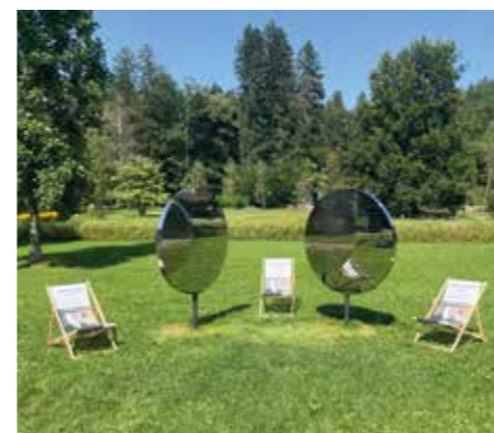
Regina Hübner's „Alles ist mit Allem verbunden“

Im Gesundheits- und Thermenresort werden laufend Ausstellungen zu ausgewählten Themen oder Schwerpunkten veranstaltet. Weiters können im gesamten Gesundheits- und Thermenresort Kunstwerke in den Bereichen Malerei, Design, Skulptur, Glaskunst, Fotografie sowie Installationen von österreichischen und internationalen Künstlern bewundert werden. Es besteht auch eine Zusammenarbeit mit dem Kunsthistorischen Museum in Wien: Im Hotel werden die laufenden Ausstellungen beworben. Gäste haben auch die Möglichkeit, an Führungen durch das Gesundheits- und Thermenresort teilzunehmen. Bei Interesse ist die Hotelrezeption gerne behilflich.