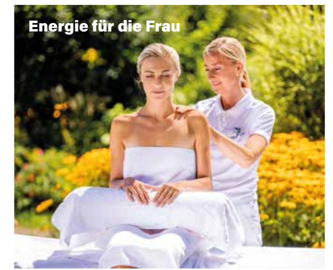
Energie für die Frau