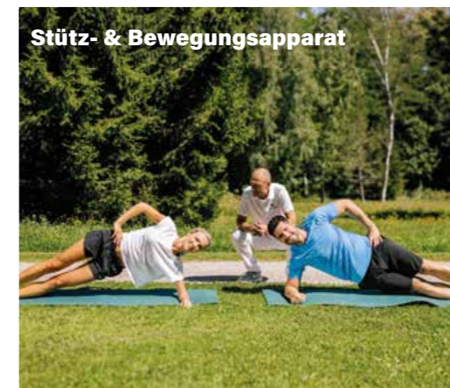
Stütz- & Bewegungsapparat

Im 5-Sterne-Traditionshaus Warmbaderhof erleben und spüren Sie die einzigartige Kombination aus Urlaubsresort und medizinischem Gesundheitszentrum. Wählen Sie aus 4 Medical-Spa-Paketen Ihren individuellen Gesundheitsaufenthalt mit höchstem Urlaubsgenuss. Unser hochqualifiziertes Team steht Ihnen in der hoteleigenen VIBE-Therapie und VIBE-Beauty-Abteilung zur Seite. Das Besondere: Alle Pakete beinhalten den bei unseren Gästen sehr geschätzten VIBE-Therapiecheck. Dabei handelt es sich um ein persönliches diagnostisches Anfangsgespräch, auf dessen Basis das individuelle Therapieprogramm für Sie zusammengestellt wird. Der Paketpreis umfasst eine bestimmte Anzahl von Anwendungen, Massagen und Therapien, die individuell auf Sie abgestimmt werden. Ebenfalls inkludiert sind das dreifache Thermenerlebnis, feinste Gaumenfreuden aus der Haubenküche und die unvergleichliche Atmosphäre des Warmbaderhofs.