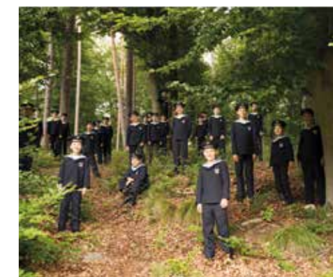
Die Wiener Sängerknaben im Warmbader Kurpark