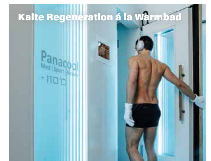
Kalte Regeneration á la Warmbad